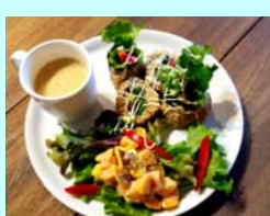
No.16 STYLE'S COFFEE ロハスな玄米 カリフォルニアロールプレート玄米と 野菜を中心としたマクロビプレート！ 5月20日（日）まで 1人前 1,080円（税込）