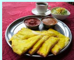
No.10 チーズナンカレーセット 5種類の辛さから選べるカレーと そのまま食べても美味しいチーズナン お一人様 1,296円（税込）