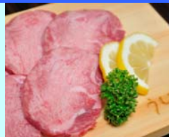
No.4 ういす 上たん 厨房で捌きたての牛タンをご堪能ください 1人前 100g 1,814円（税込）