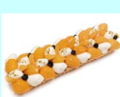
No.22 Café comme ça ピワのメーブルティラミス 長崎産のピワを使用した モザイクモール港北限定タルト 1ピース 702円（税込）