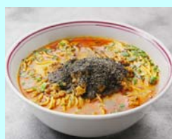
No.15 黒ゴマ坦々麺セット 通常より少し太めの生麺を使用 黒ゴマをたっぷり使って辛くて香ばしい あとひく美味しさをお楽しみください！ 1杯 1,080円（税込）