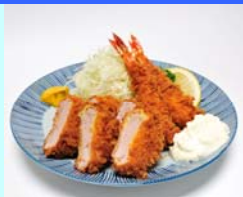
No.2 とんかつ稲 海老ヒレかつ定食 契約農場である若手農の胆沢養豚の SP豚（無菌豚）を使用 ごはん、味噌汁、お新香付き 1,620円（税込）