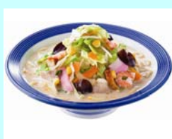
No.12 野菜たっぷりちゃんぽん 1日に必要な野菜をこの一杯で！！ 安心安全国産野菜 1杯 777円（税込）