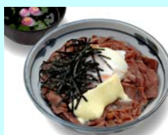
No.6 牛丼 牛丼(白) 甘辛く煮た牛丼に、バターと 温泉玉子、刻みのりをトッピング 745円(税込)