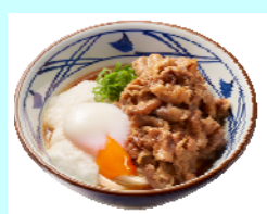
No.11 牛とろ玉うどん 甘辛い牛肉ととろろに温泉玉子 三位一体の美味しさ！！ (並) 690円(税込)