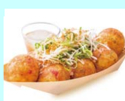
No.20 香るゆずポンおろし シャキシャキしらがねごと 国産柚子果汁の香りが爽やか 8個入り 680円（税込）