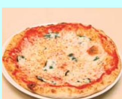
No.17 マルゲリータ トマトソース、バジル、 モッツアレラチーズ 1枚（直径24cm） 650円（税込）