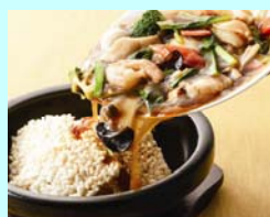
No.8 上海酒 DINING 五目おごげ ジューシーという音が美味しい 具沢山のおごげ 1人前 1,320円（税込）