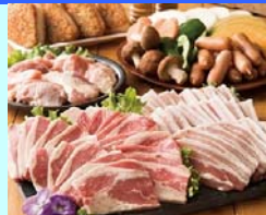
No.5 レギュラーセット 手ぶらバーベキューコース レギュラーセット バーベキュー利用料、レギュラー食材セット ソフトドリンク飲み放題 お一人様 3,758円（税込） ※写真はイメージです