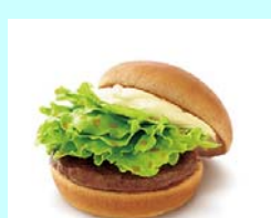
No.18 クリームチーズテリヤキバーガー 甘い醤油味にクリームチーズの酸味と コクを加え、濃厚な味わいに！！ 単品 390円（税込）