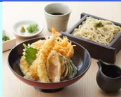
No.1 花旬庵 運子鯛と海老の季節の天丼セット 下関産運子鯛と海老、季節の野菜を 使った天丼は冷たいおそばとセットで 1人前 1,059円（税込）

各店一押しメニューをご注文いただいたお客様に投票用紙をお渡しします。地下1階、5階に設置しております 投票BOXに住所・氏名をご記入の上、ご投票いただいたお客様の中から抽選で20名様に5,000円分のお食事券プレゼント！