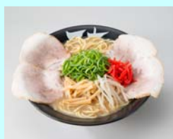
No.13 鶏白湯中華そば 鶏と野菜をじっくりと 炊き込んだスープが絶品 1杯 690円(税込)