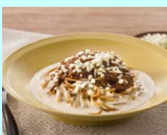
No.7 ホワイトポトノーゼ チーズソースをたっぷりかけて よりマイルドになったポトノーゼは 今しか味わえない一品です！ 1人前 1,285円（税込）