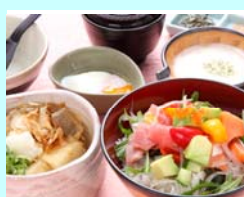
No.9 まぐろ マグロとサーモンの海鮮ベジとろろと 揚げ出し豆腐 小とろろ付 お一人様 1,436円（税込）