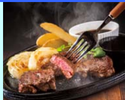
No.3 IBAQUET パンギングテンダーステーキ 脂肪が少ない肉質は肉厚でも柔らかく 肉本来の上質な味わいを楽しめます パン食放題付 1人前 130g 1,609円（税込） ※190g、260gもありです