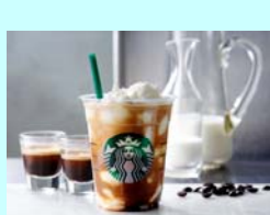
No.21 STARBUCKS エスプレッソアフォガードフラベチーノ® ドリップコーヒーやラテが好きな方 新たな発見を届ける、大人フラベチーノ Tallサイズ 594円（税込）