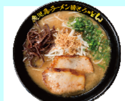
No.14 鹿兒島ラーメン豚とろ・どん 魚介をきかせたすっきり豚骨スープに 柔らかな食感が自慢の豚とろチャーシュー 1杯 750円（税込）